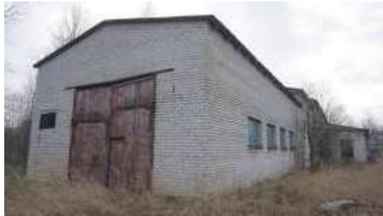
Nedzīvojamā ēka – degvielas noliktava ar kadastra apzīmējumu 7894 002 0093 017