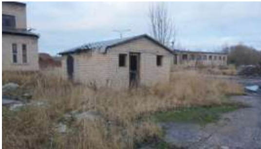
Nedzīvojamā ēka – ražošanas ēka ar kadastra apzīmējumu 7894 002 0093 008