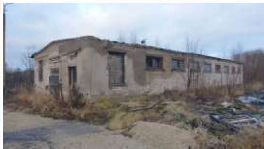
Nedzīvojamā ēka – automašīnu mazgātava ar kadastra apzīmējumu 7894 002 0093 016