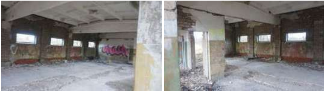
Nedzīvojamā ēka – noliktava ar kadastra apzīmējumu 7894 002 0093 010