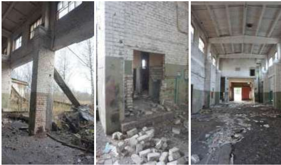
Nedzīvojamā ēka – gāzes balonu noliktava ar kadastra apzīmējumu 7894 002 0093 005